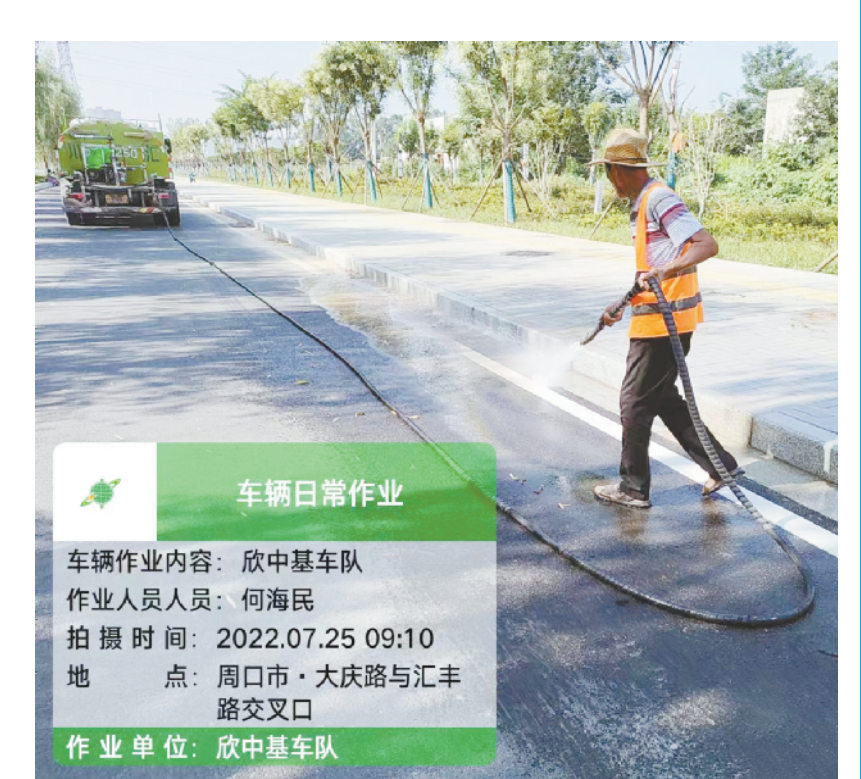
道路保洁一丝不苟。