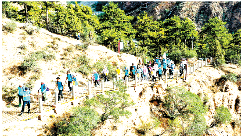
全民健身——全国群众健身登山大会在贺兰山举行

7月31日,徒步登山爱好者在比赛中(无人机照片)。当日,全国群众健身登山大会暨第一届贺兰山全国登山大赛在宁夏贺兰山国家森林公园举行。来自全国9个省区市的200名专业参赛选手及600余名徒步登山爱好者参加了本次比赛。