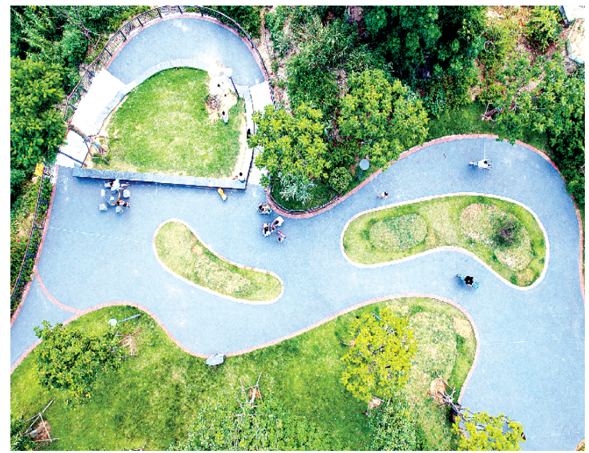
厦门:“口袋公园”提升市民生活幸福感

人依法优先安检和检票通道;划设军人候车区,满足了军人及家属出行需求。在做好军人出行依法优先的同时,各车站还将军人依法优先向战备训练拓展,为部队机动、演训提供全方位服务。此外,铁路部门在每年的新老兵运输中,优先安排乘坐高铁、动车和城际列车,长三角、珠三角地区还将地铁纳入运输投送保障网络,使新兵运输投送实现地铁与高铁的无缝衔接,有力地提升了部队投送效率,让军人依法优先全方位落实到国防建设全过程。