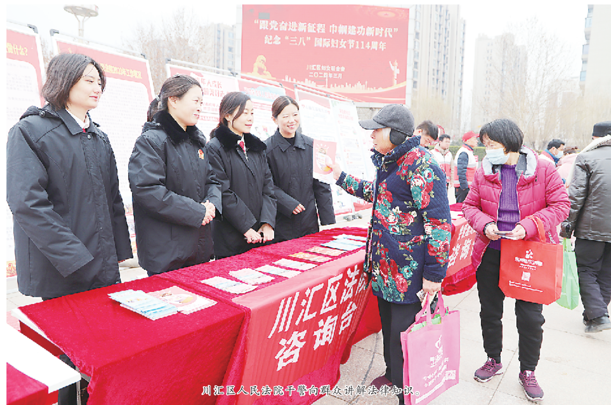
川汇区人民法院干警向群众讲解法律知识。

川汇区人民法院通过开展此次活动,进一步增强了妇女群众的维权意识,营造了男女平等、尊老爱幼的良好社会氛围。下一步,川汇区人民法院将坚持党建引领,加强队伍建设,积极延伸审判职能,坚决捍卫妇女群众的合法权益,持续以法之名守护“她”权益,守护每一个闪闪发光的“她”。