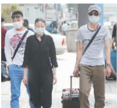
6月6日,行人经过位于韩国首尔东大门附近的韩国中央医院附近。