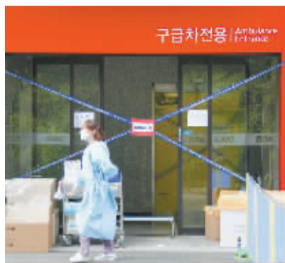
6月6日,在韩国首尔,医护人员经过已经被暂时封闭的一家大型医院急诊室门前。目前,共有7名患者在这家医院被感染 MERS。

第二个“意料之外”是医院成为传播病毒的温床。原本是应该消灭病毒的医院,却成为这次病毒传播的催化剂。据韩国保健福祉部通报,目前出现的64例确诊患者全部集中发生在6家医疗机构内。其中,韩国京畿道平泽圣母医院导致了36名患者被感染 MERS 病