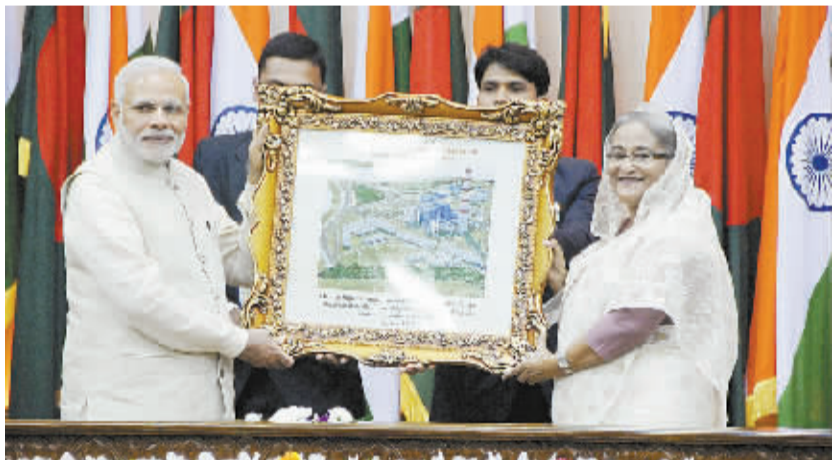
印度和孟加拉国签署多项文件加强合作 6月6日,在孟加拉国达卡举行的新闻发布会上,孟加拉国总理哈西娜(右)向印度总理莫迪赠送电站项目效果图。孟加拉国总理哈西娜6日正在孟加拉国访问的印度总理莫迪举行会谈,两国当天签署多项文件加强合作。

潘基文再次呼吁重新实现人道主义停火,以便也门人民能够得到人道主义援助,这也有助于营造一个和平的对话气氛。声明说,人道主义援助是极为紧迫和重要的,因为持续的冲突导致也门人民的痛苦急剧增加。