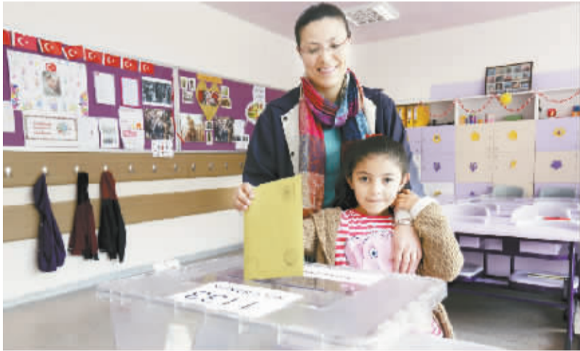
土耳其举行议会选举 6月7日,在土耳其首都安卡拉一个投票站,一个小女孩帮妈妈投票。土耳其议会选举当日开始投票。执政的正义与发展党、主要反对党共和人民党、民族行动党和亲库尔德的人民民主党在内的20个政党参加竞选,角逐550个议会席位。

阿联酋迪拜一名21岁中国男子4日在公寓楼货梯内遭遇抢劫并被杀害,随身携带的102万迪拉姆(1美元约合3.7迪拉姆)现金被凶犯抢走。中国驻阿联酋首任总领馆在案发后第一时间启动应急机制,敦促迪拜警方全力侦破,同时提醒在阿中国侨民和游客切实提高风险防范意识,采取必要措施加强自我安全保护。